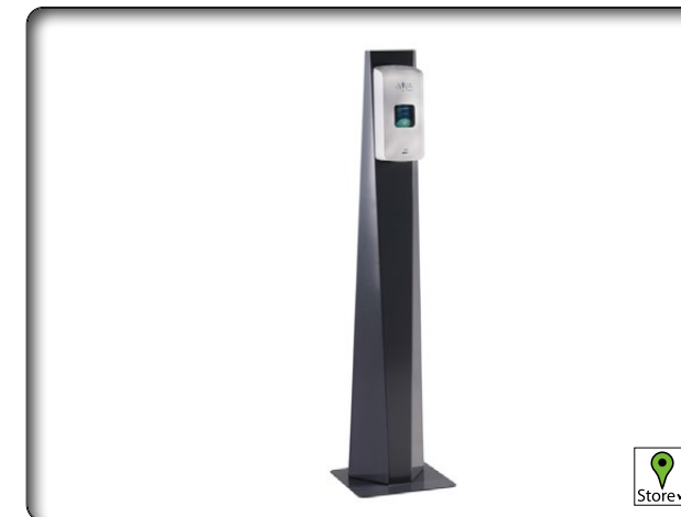
Herwe Hygienestation 70245 eVIVA 1000 ml Touchless

Umfassendes und schnelles Wirkungsspektrum gegen Bakterien, Pilze und verschiedenste Viren. Wirkt bakterizid, levurozid, tuberkulozid (M.terrae), mykobakterizid (M.avium und M.terrae), virusinaktivierend inkl. Noro-, Rota- und Adenoviren sowie gegen HBV/HIV/HCV (begrenzt viruzid PLUS)