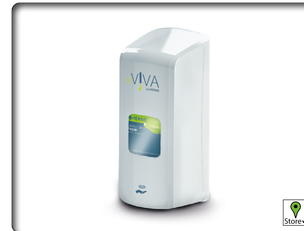
Herwe Spender 70410 eVIVA 1000 ml Touchless

Leicht fettend, Emulsionstyp O/W, enthält Naturöle und Bienenwachs, schwach parfümiert, silikonfrei