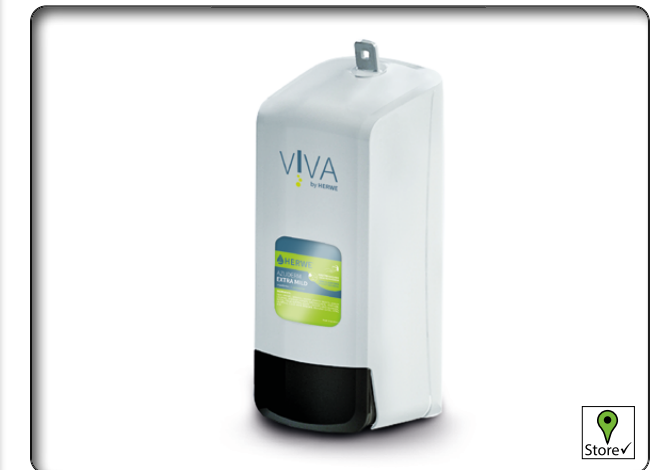
Herwe Spender 70310 VIVA 1000 ml Manuell