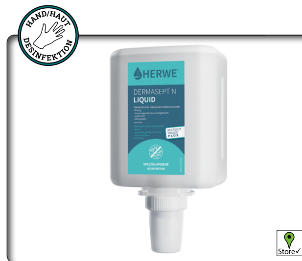
Herwe Dermasept N Liquid

Geprüft nach EN 1500, HACCP-konform, gelistet nach VAH (DGHM) und IHO (Viruzidieliste), wirkt bakterizid, levurozid, virusinaktivierend inkl. Noro- und Rotaviren sowie HBV/HIV/HCV (begrenzt viruzid)