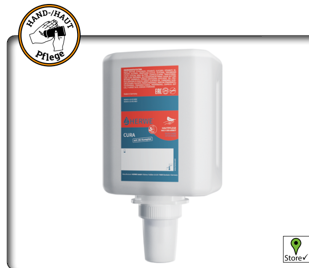
Herwe Hautpflegecreme Cura

Seifenfreies Hautreinigungsgel mit hautfreundlichen Zuckertensiden, auch für die Körperreinigung geeignet, dem pH-Wert der Haut angepasst, ohne Konservierungsmittel (Konservierungsstoffe gem. EU-Verordnung), parfümfrei und farblos