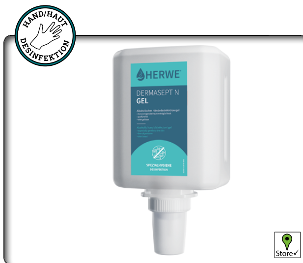
Herwe Dermasept N Gel