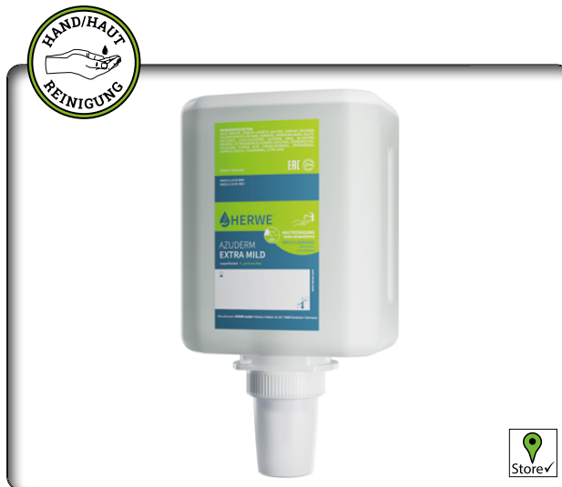
Herwe Hautreinigungsgel Azuderm extra mild