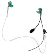
Phonak Serenity SPC