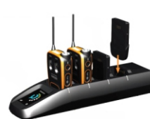
Ladeschale für Funkgerät